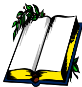
LEER SU PALABRA